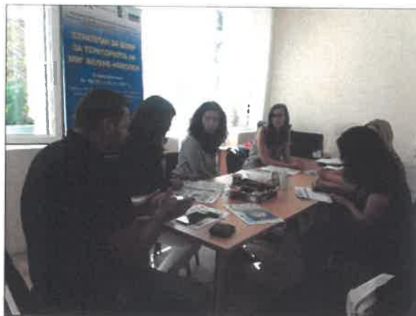
Работна среща с МИГ Белене-Никопол