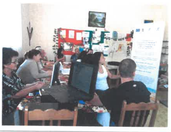
Еднодневна среща в с. Бъркачево

Екипът на МИГ Бяла Слатина и членове на Колективния върховен орган са организирани и провели също така успешно,