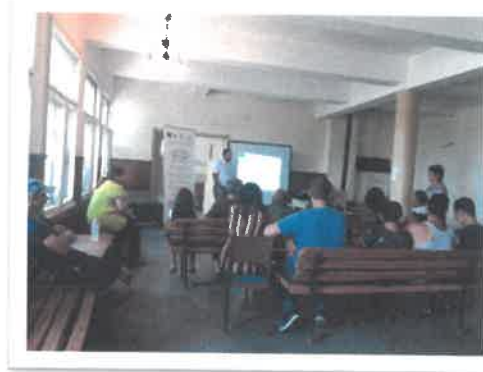
Еднодневна среща в с. Враняк

редица еднодневни срещи с потенциални кандидати в различни населени места от територията. Срещите са проведени на 05.09.2018 г., 07.09.2018 г., 12.09.2018 г. и 13.09.2018 г. съответно в читалищата на с. Бъркачево, с. Враняк, с. Габаре и с. Алтимир. Целта на срещите е фокусирана върху това всички заинтересовани лица да получат експертни съвети, касаещи подготовката на