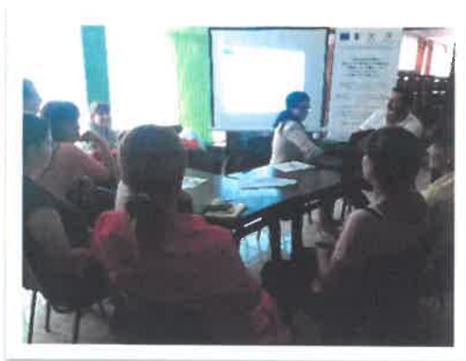
Еднодневна среща в с. Габаре

проектните предложения, както и информацията относно условията и сроковете за прием. Видно от списъците, на срещите са присъствали общо 56 души, на които е предоставена подробна информация по предстоящи приеми, кандидатстване с проекти, като всеки един участник е имал възможност да задава доизясняващи въпроси, съответно да получи компетентни отговори от страна на екипа на Сдружение „МИГ Бяла Слатина“. Зададените въпроси основно са свързани с условията за кандидатстване, размера на самоучастието и размера на безвъзмездната финансова помощ по проектите, както и разрешаване на конкретни казуси, свързани с регистрацията на физически лица като земеделски производители. Обсъждани са и възможностите за закупуване на оборудване посредством комбинирано финансиране от финансова помощ и заем от банка, възможностите за закупуване на прикачен инвентар, земеделска техника и начина, по който се изчислява СПО, възможностите за разнообразяване и диверсификация на дейността, закупуване на пчелни кошери и животни, възможностите за закупуване на земя и създаване и презасаждане на трайни насаждения, както и за ремонт и модернизация на ферми и други сгради и помещения.