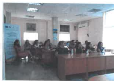
Семинар в с. Търнава