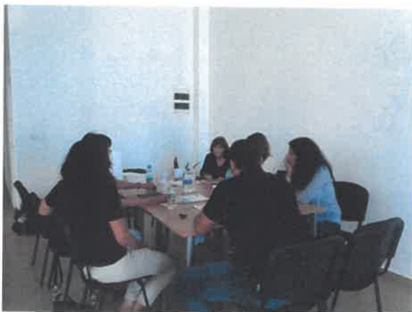
Работна среща с МИГ Ябланица-Правец