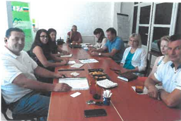
Работна среща с МИГ Троян-Априлци-Угърчин