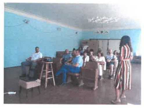
Еднодневна среща в с. Алтимир

В периода 10.09.2018 г. – 11.09.2018 г. е проведено двудневно обучение на екипа на МИГ Бяла Слатина и членове на Колективния върховен орган /КВО/ по процедурите за подбор и оценка на проекти. Темите на обучението са били свързани с изискванията при подготовката на Условия за кандидатстване и образци на документи, запознаване с правилата за държавни помощи, критерии за допустимост и процедура за подбор на проекти, оценка на проектни предложения – техническа и финансова и работа в ИСУН 2020 – създаване на процедура за кандидатстване, подаване на проектно предложение и създаване на оценителна комисия. Обучението е оценено като изключително полезно от екипа и членовете на КВО предвид ангажимента на МИГ за изготвяне на документите за кандидатстване и публикуването на насоките в ИСУН 2020.