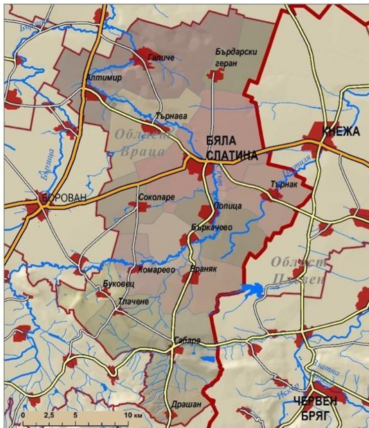
МЕСТНА ИНИЦИАТИВНА ГРУПА (МИГ) БЯЛА СЛАТИНА

ТЕРИТОРИЯ АДМИНИСТРАТИВНА КАРТА ТРАНСПОРТНА ИНФРАСТРУКТУРА